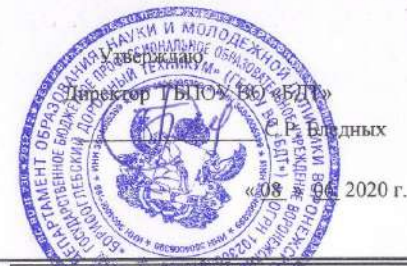
График защиты дипломных проектов специальности: 08.02.05 кабинет № 201