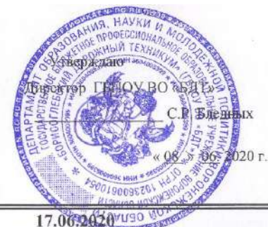
График защиты дипломных проектов специальности: 08.02.05 кабинет № 201