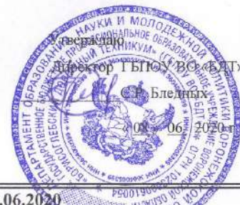
График защиты дипломных проектов. Комиссия специальности 23.02.04 кабинет № 235